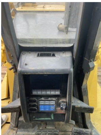
Cabina De Operador