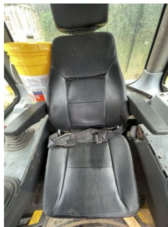
Sillón De Operador