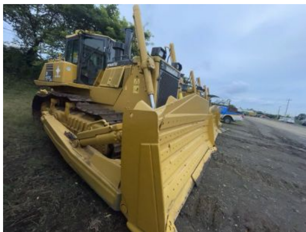
Vista Lateral Derecha