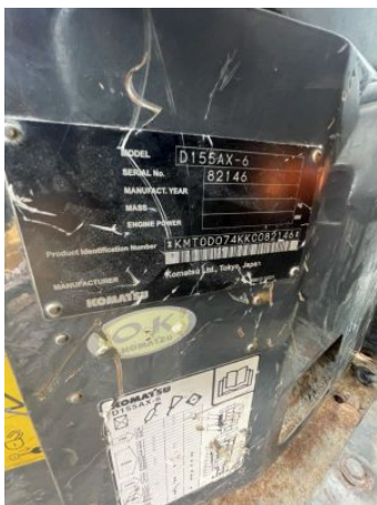
Placa De Equipo