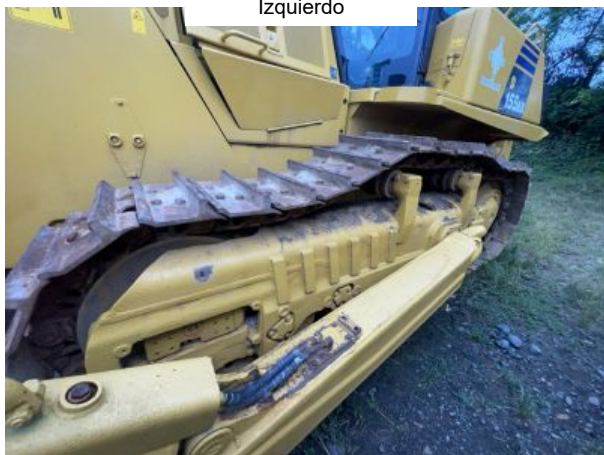
Tren De Rodaje Izquierdo