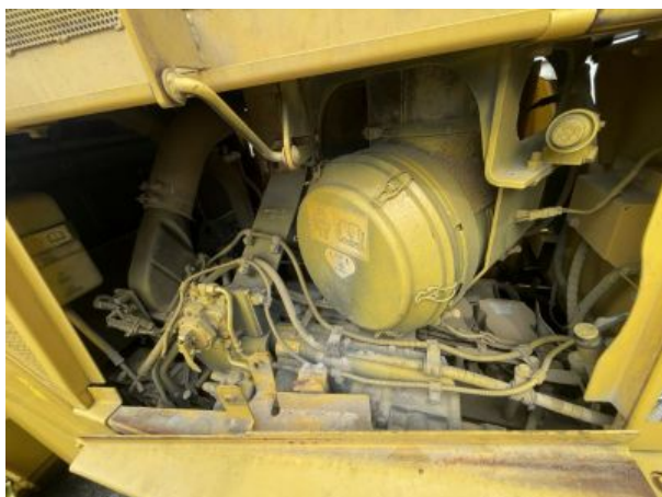
Motor del Equipo