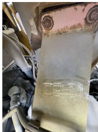
Placa De Motor