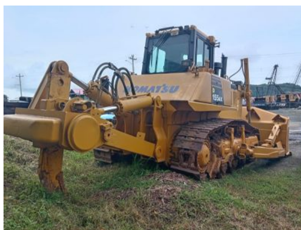
Vista Lateral Derecha